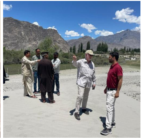
Fact-Finding auf dem Grundstück

SCHOOL - HOSTEL - AUDIOLOGY NARJIS KHATOON SCHOOL FOR DEAF SKARDU