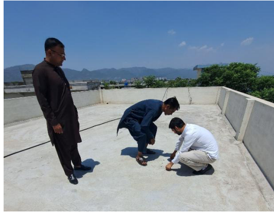
Feststellung baulicher Rahmenbedingungen