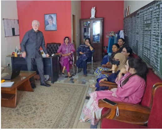
Einweisung in den Planungsstand