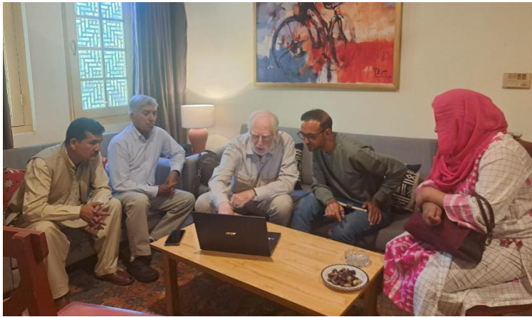
Information des lokalen Architekten

Der Vorsitzend PHzSHeV entschied, trotz der angespannten Lage, nach PAKISTAN zu fliegen. Als Voraussetzung für einen späteren Förderantrag war es dringend erforderlich, mit Partnern vor Ort ein Fact-Finding durchzuführen.