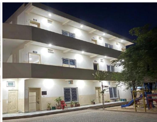
und so soll es werden

Die Prüfungen ergaben, dass die gegebene Statik nicht den Anforderungen für eine Aufstockung genügt. Verstärkungen der Struktur sind einzuplanen.